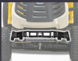
TRAIN AVANT PIVOTANT